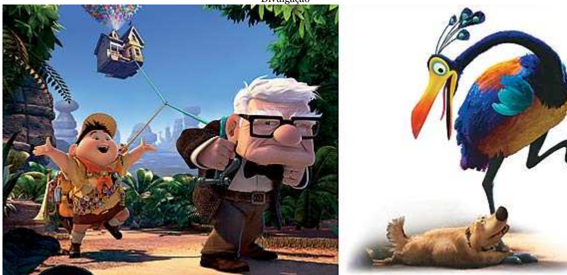
METÁFORAS VISUAIS: Russell, o gordinho otimista, e o misantropo Carl puxam a casa voadora; à esquerda, a esquisita ave Kevin e Dug, o cão falante: computação gráfica com alma